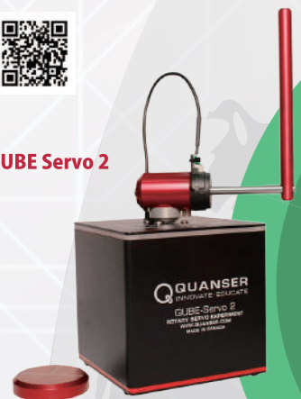
世界で唯一の制御工学を学べる教育教材