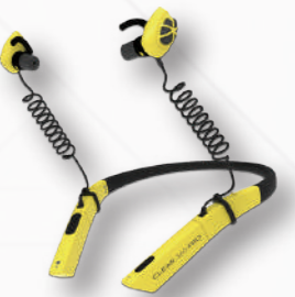
CLEAR 360 PRO

米国 Bongiovi Acoustics 社が保有する独自の音響処理技術で音質を改善します。難聴者向けソリューションの開発や防災、医療、家電、車、航空、エンターテインメントなど、目的に応じて使用可能なアプリケーションは多数。まずはデモで、その凄さをご体験ください。